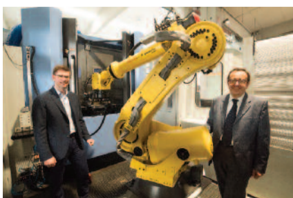
Valvole Hofmann ha sede a Occhieppo Inferiore (Bi) - www.valvolehofmann.com

terale positivo, in quanto l'azienda avrebbe comunque portato a termine gli stessi investimenti. Uno degli obiettivi fondamentali nel prossimo futuro sarà lo sviluppo di prodotti pienamente integrati e in grado di comunicare con ogni network aziendale». «Il trend sembra portare all'utilizzo di valvole di maggiori dimensioni; la nostra percezione è che si presti anche maggiore attenzione all'ottimizzazione dei sistemi ricercando l'efficienza dei processi industriali; ciò si trasmette a noi come richiesta di perfezionamento dell'offerta tecnica. Il dimensionamento, la scelta dei materiali e della valvola devono essere fatti in maniera impeccabile: noi siamo pronti». •